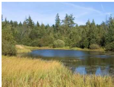
FOTO 13. Vista del medio ambiente.

Se puede definir como “un desarrollo que satisface las necesidades del presente sin poner en peligro la capacidad de las generaciones futuras para atender sus propias necesidades”.