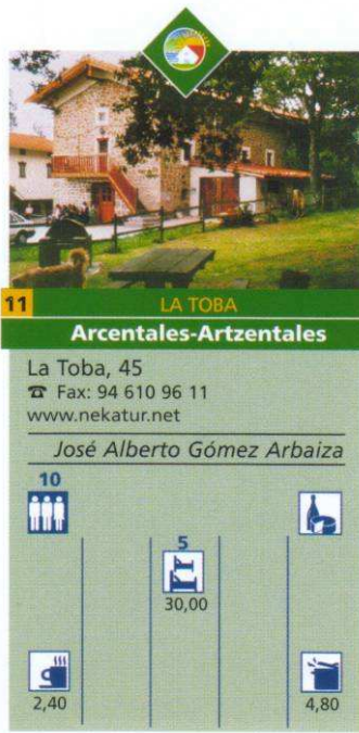
La Toba, Bizkaia.