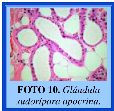
FOTO 10. Glándula sudorípara apocrina.

Las glándulas sudoríparas apocrinas, se encuentran en las axilas, el pubis, las aureolas mamarias, el área genital y el cuero cabelludo. Están localizadas en la grasa que está debajo de la piel y desembocan en los folículos pilos sebáceos. Gran parte del sudor es secretado por estas glándulas, mejor conocidas como sudoríparas.