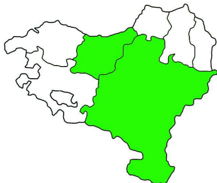
MAPA 12. Localización de la Sasi Ardia, Gipuzkoa y Navarra.

Esta raza se localiza principalmente en la zona de Gipuzkoa y Navarra, en las localidades de de Oiartzun a Leizarán y de Hernani a Goizueta.