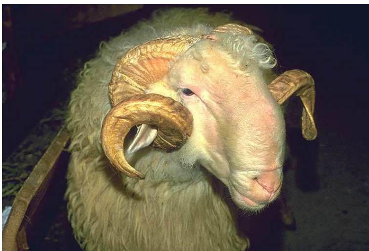
FOTO 13. Basco Bearnaise.

Existe una diferencia de peso entre los machos y las hembras. El peso de nacimiento de los machos es de 3,5kg, y el de las hembras