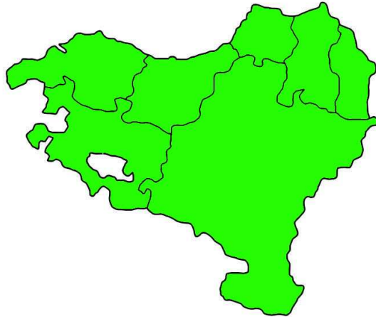
MAPA 10. Localización Latxa.

La latxa habita generalmente en toda la comunidad autónoma del país vasco: Gipuzkoa, Bizkaia, Araba, Iparralde y Navarra.