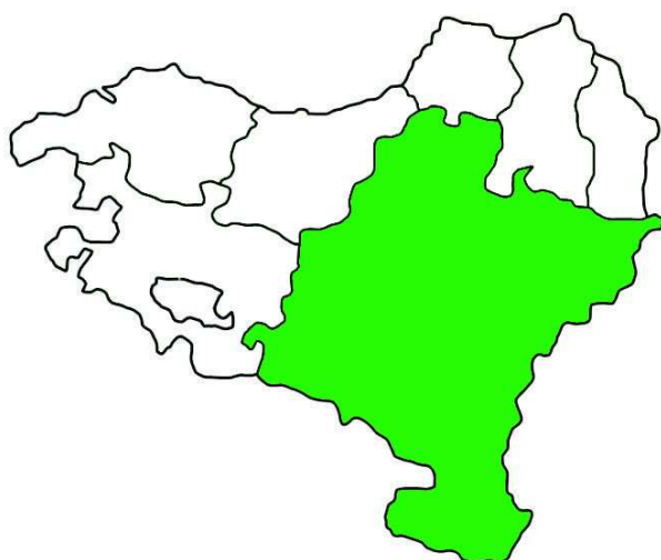
MAPA 11. Localización de la Raza Navarra.

Es una raza extendida mayoritariamente en Navarra y en menor medida en las provincias limítrofes (Alava, Soria, La Rioja, Zaragoza y Huesca). Los pastos comunales acogen a un elevado número de rebaños. En este sentido, las tierras pastables se agrupan en lotes o polígonos de una determinada superficie, que se denominan “corralizas”, por disponer cada lote de su correspondiente corral, donde se albergan los animales.