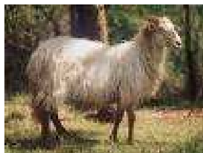
FOTO 17. Sasi ardia.

En cuanto al aspecto general son animales de pesos medios tendiendo a ligeros, de cabezas triangulares y perfiles rectos, expresivas y descubiertas de vellón, con orejas pequeñas, horizontales o algo levantadas y dirigidas hacia atrás en momentos de alerta. Los troncos son largos y de línea triangular, armónicos, recubiertos de