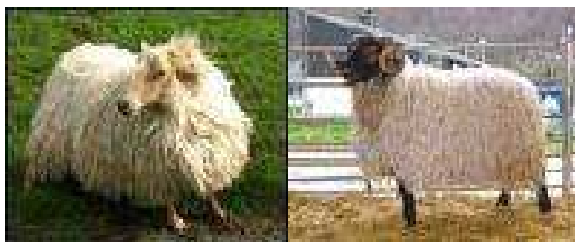
FOTO 15. Latxa cara rubia y negra.

La variedad Cara Negra es de mayor tamaño, midiendo los machos 74,5 cm. de alzada a la cruz y los machos de cara Rubia unos 64,9 cm. de media. Los cuernos están