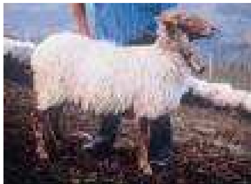
FOTO 14. Carranza cara Rubia.

La carranza es algo superior a la Latxa. Su perfil convexo o ultraconvexo, de proporciones longilíneas con lana larga y no tienen moña. Carece de vellón en el tercio superior del borde anterior del cuello. Aunque tanto hembras como machos pueden tener cuernos, en las ovejas y en los moruecos alcanzan gran desarrollo tomando en forma de espiral abierta.