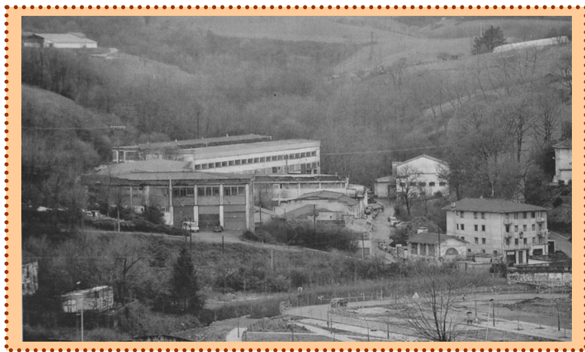
FOTO 12. Vista general del polígono industrial Papín Molinao.

promotores de Lanbarren piden que el consistorio donostiarra autorice la construcción de 300 viviendas en Molinao en lugar de 229. Presentaron la propuesta los empresarios de Molinao, pero todavía no han tenido respuesta.