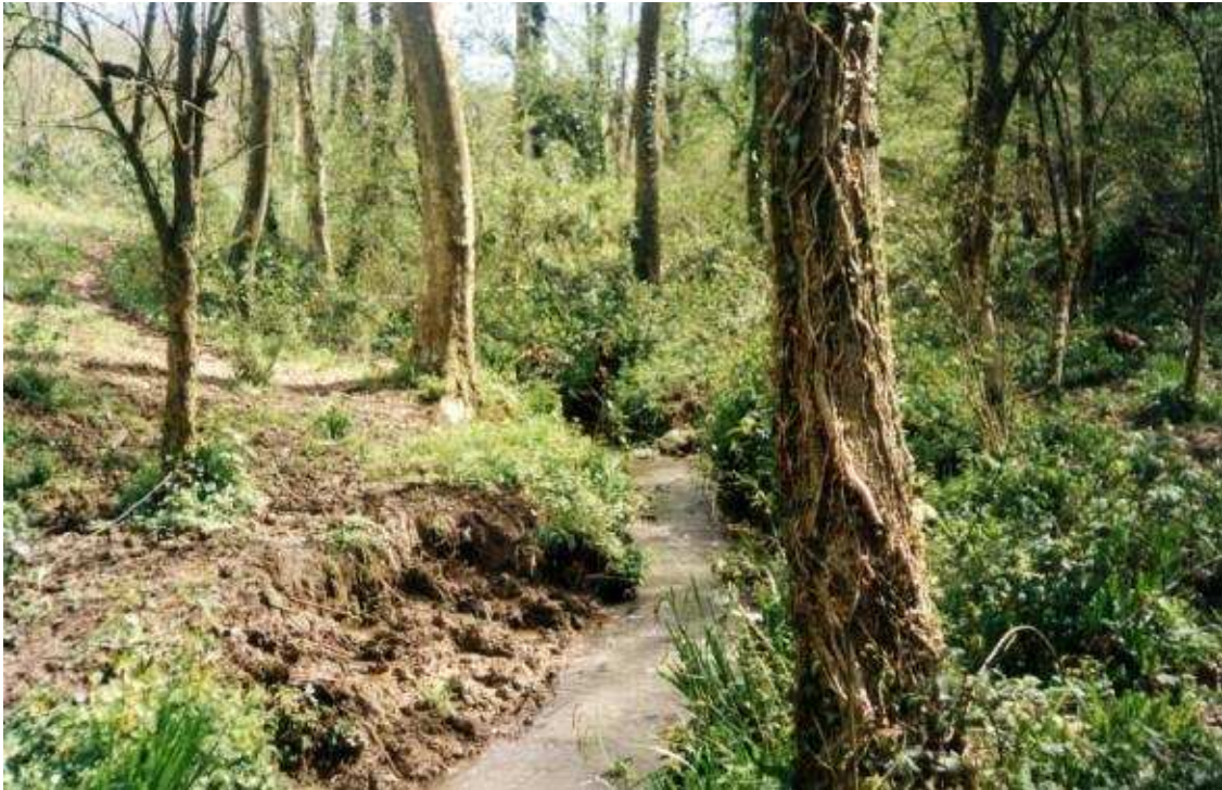
FOTO 1. Bosque de ribera en el curso alto del río Molinao.