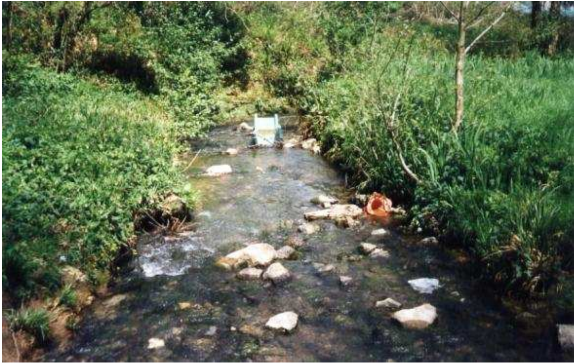
FOTO 7. Basuras en el cauce del río, zona 4.