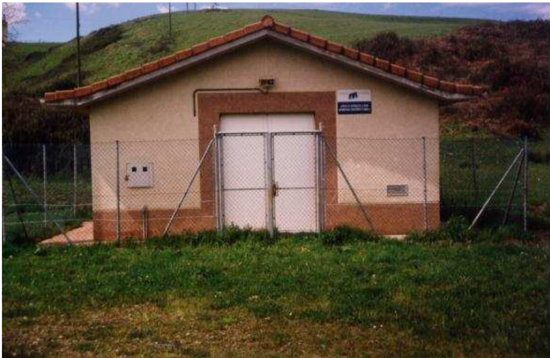
FOTO 6. Caseta de bombeo, construcción asociada a la gestión del agua.