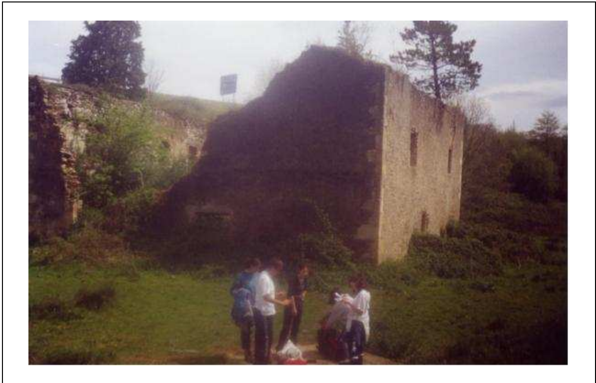
FOTO 4. Recopilando datos de la situación del entorno, zona 3, junto al caserío Galentene.