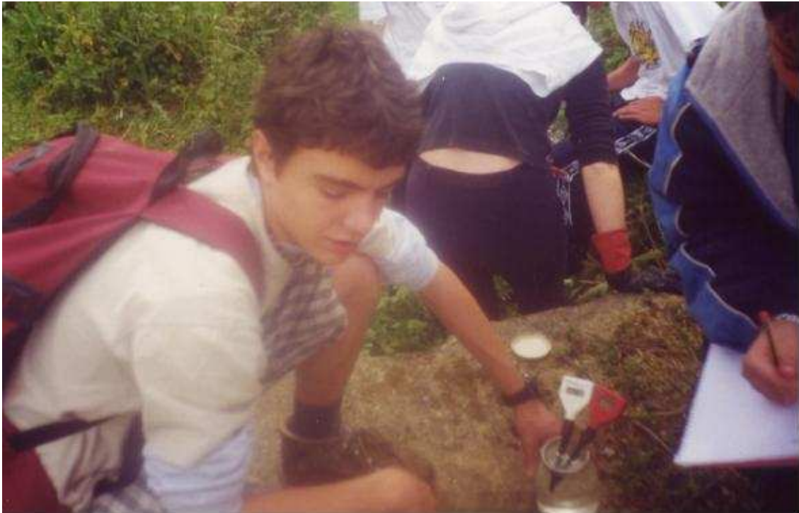
FOTO 5. Midiendo la temperatura y el pH.