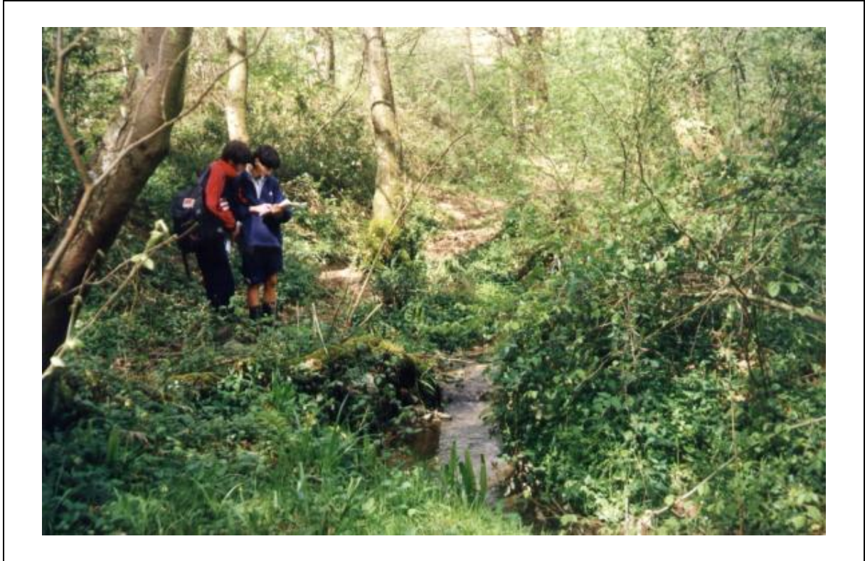
FOTO 3. Tomando datos a pie de río, zona 1.