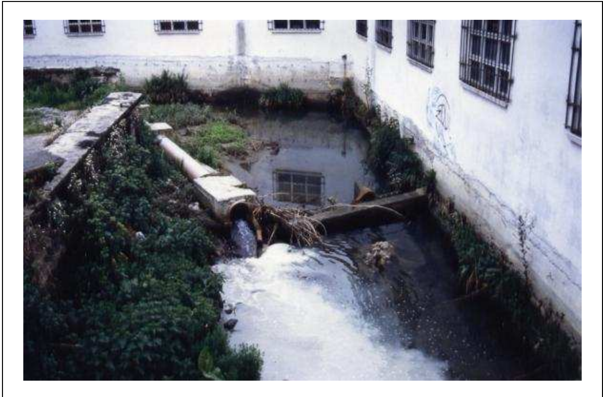
FOTO 11. Vertido de los lixiviados del vertedero de R.S.U. de San Marcos al cauce del río Molinao, zona 5.