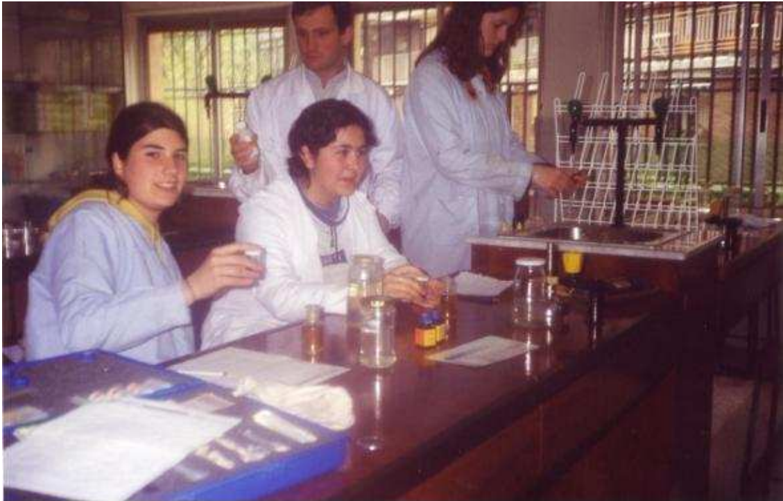
FOTO 9 y 10. Análisis químicos en el laboratorio, O_2 disuelto y Fosfato.