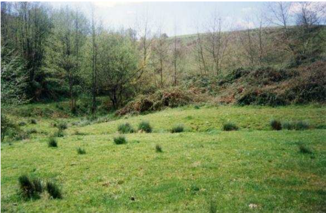
FOTO 2. Bosque de ribera y pastizales en la zona 2 del río Molinao.