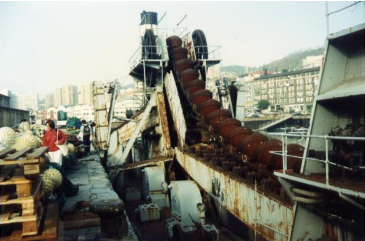
FOTO 14. Analizando el estado de la DRAGA JAIZKIBEL.