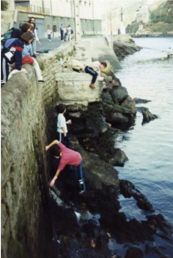
FOTO 5. Unidad 4, recogiendo muestras de agua.