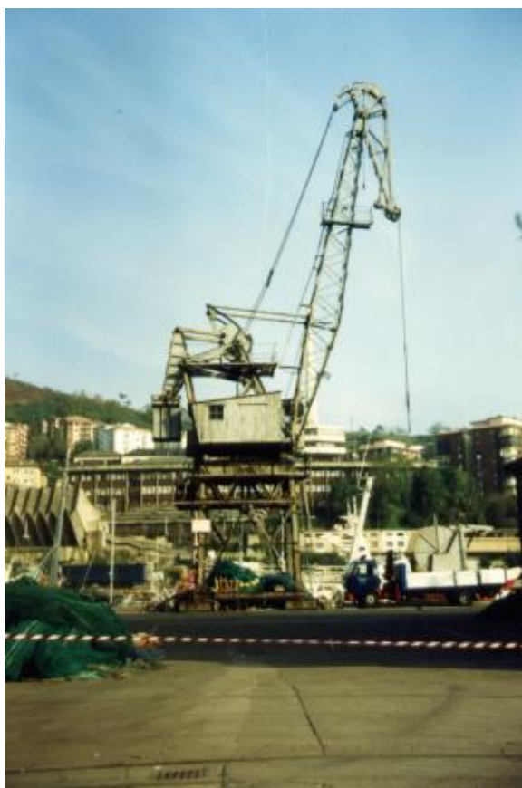
FOTO 12. Única grúa antigua existente en el Puerto. Recuerdo del pasado.