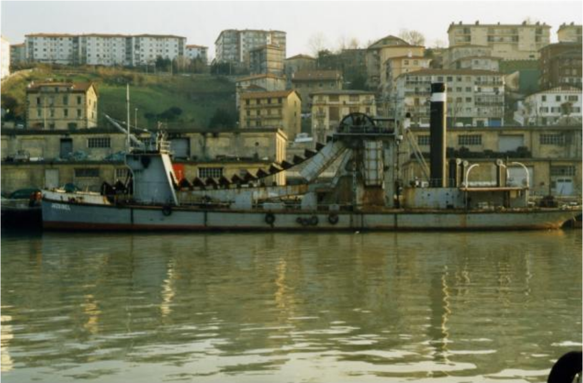
FOTO 13. Vista general de la DRAGA JAIZKIBEL.