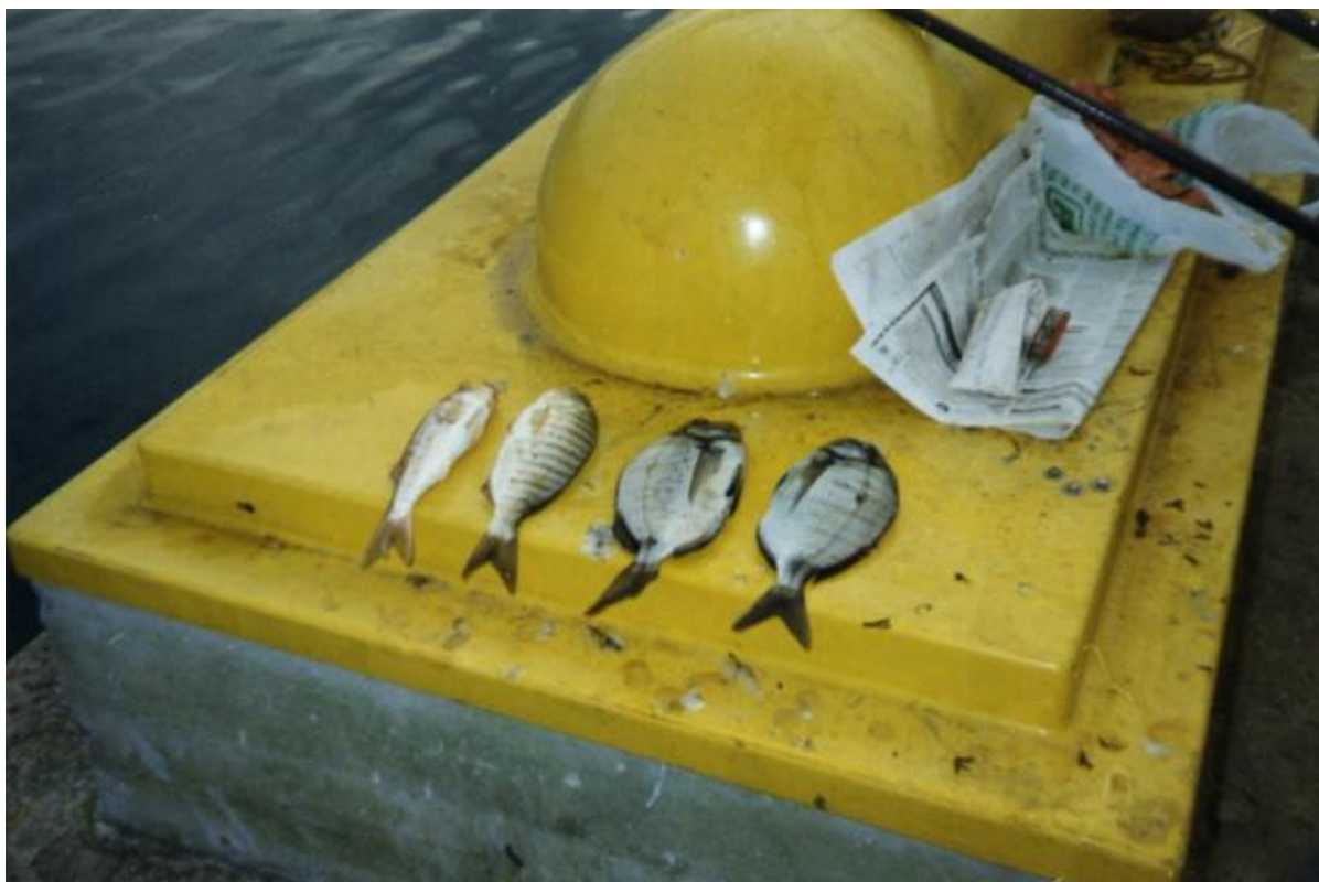
FOTO 11. Una mañana de pesca en el Puerto de Pasaia.