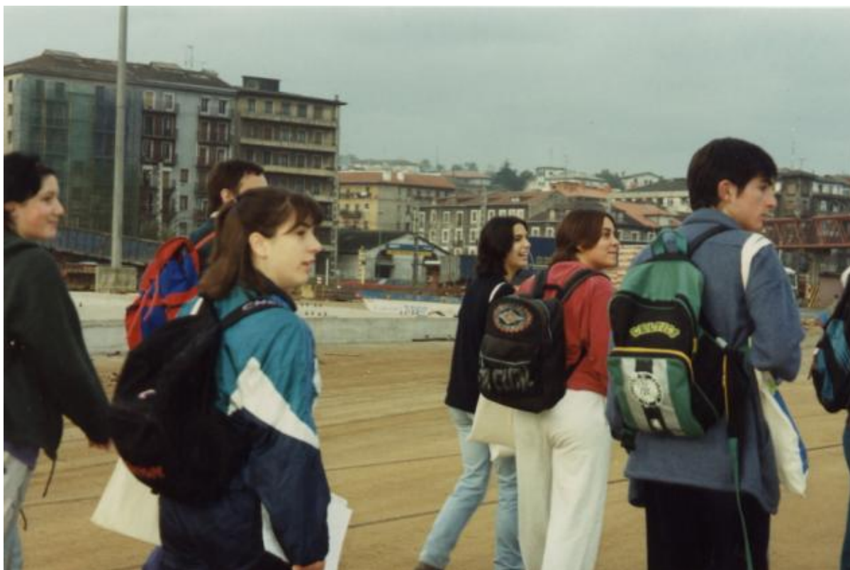
FOTO 3. Grupo de investigadores en actividad.