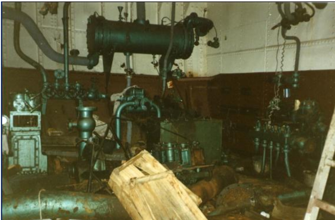
FOTO 16. DRAGA JAIZKIBEL, sala de máquinas.