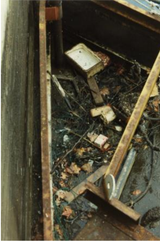
FOTO 9. Unidad 9, aspecto del mesolitoral.