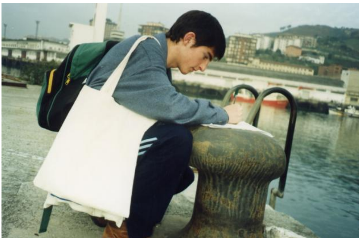
FOTO 4. Cualquier apoyo es válido.