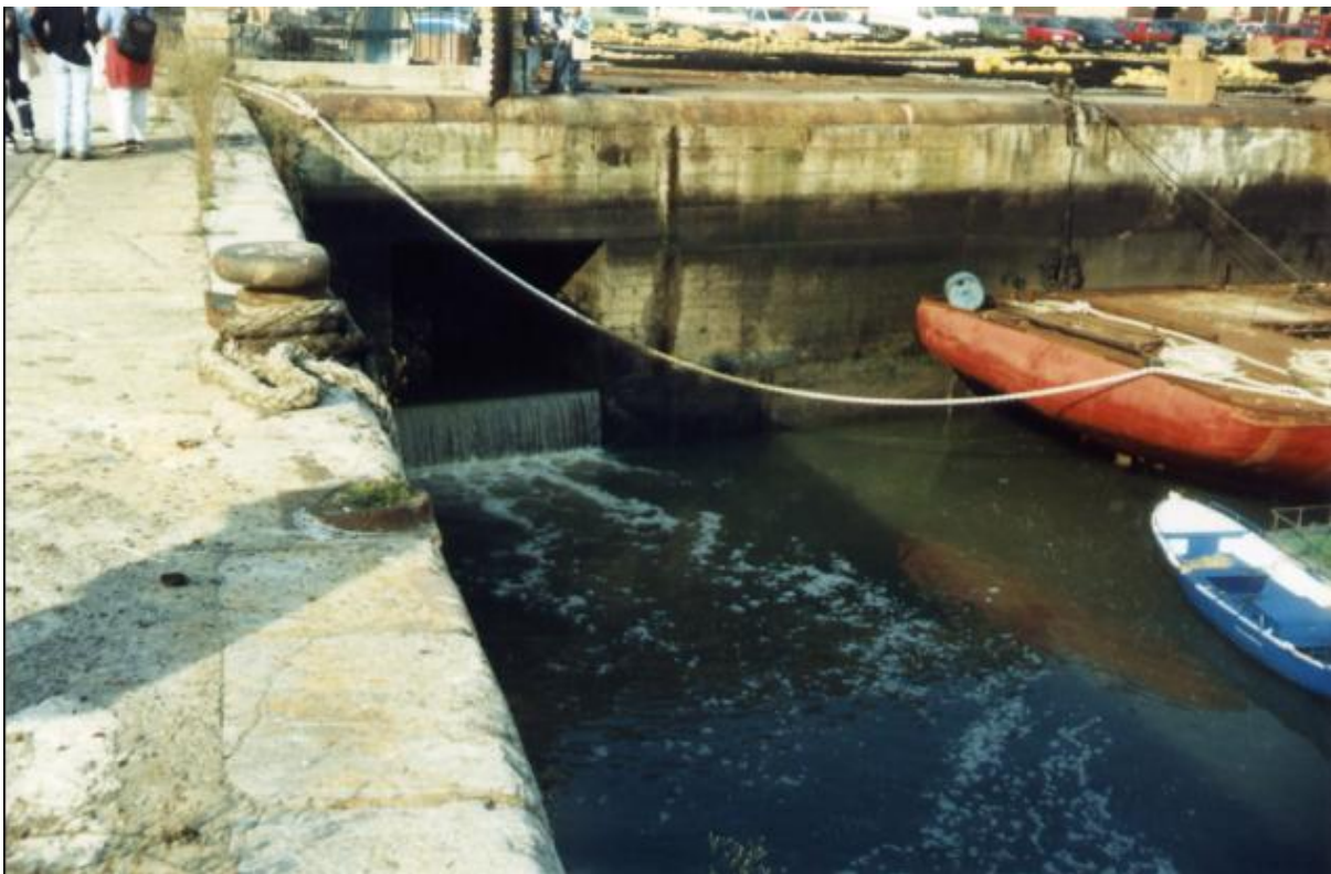
FOTO 10. Unidad 6, colector de Herrera con alto índice de contaminación.