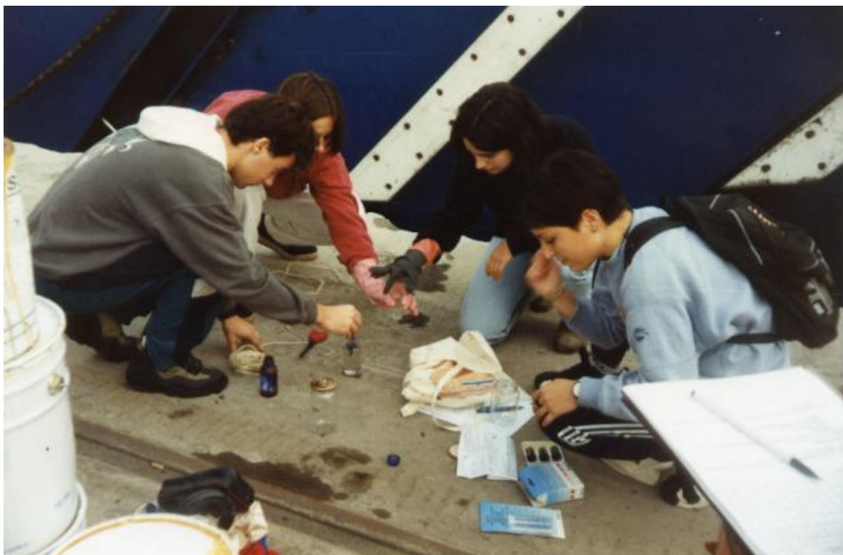
FOTO 6. Analizando las muestras de agua.