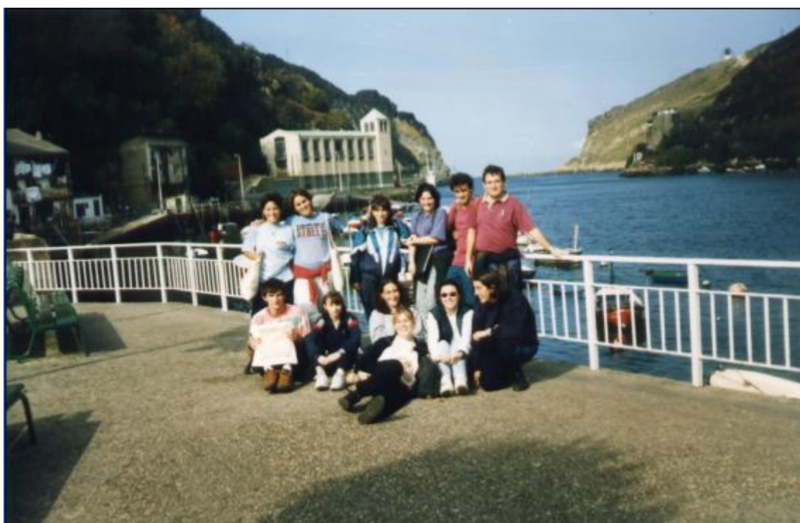
FOTO 17. Grupo LA ANUNCIATA IKASTETXEA al finalizar la actividad.