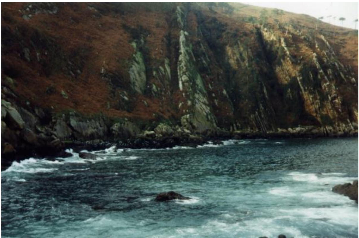
FOTO 2. Unidad 1 y 2, acantilados costeros de Senekozuloa.