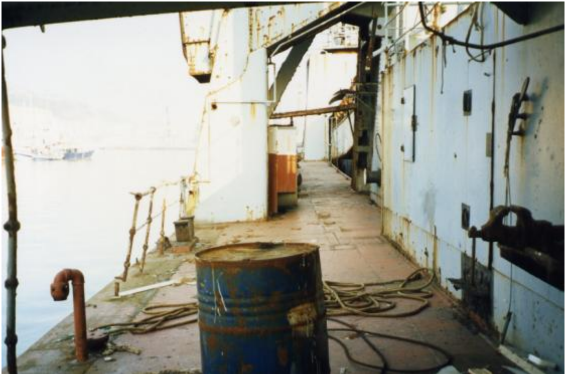
FOTO 15. Vista parcial de la DRAGA JAIZKIBEL.