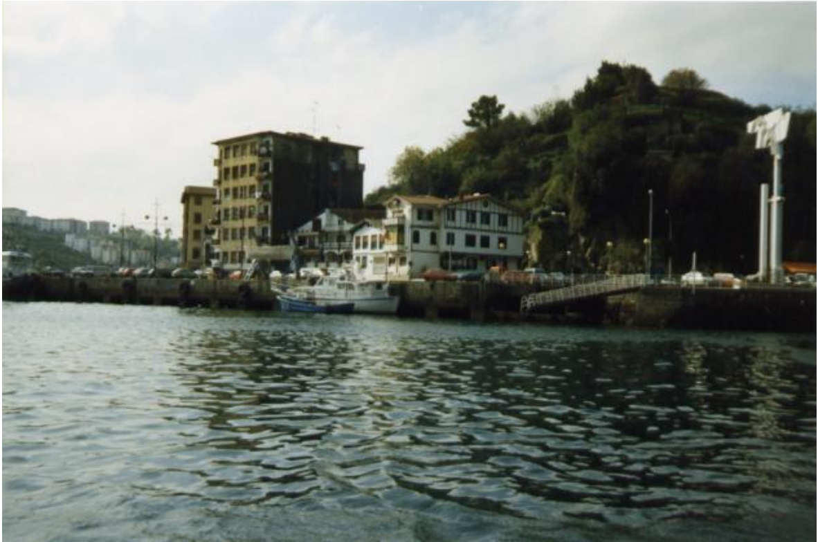
FOTO 1. Unidad 4, Pasai San Pedro.