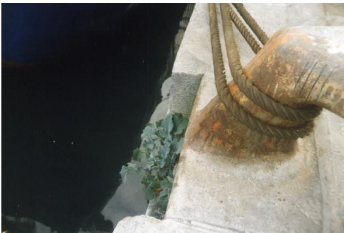
FOTO 8. Unidad 10, plantas en los resquicios del muelle.