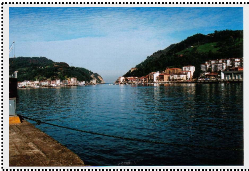
FOTO 5. Bahía de Pasaia, objeto de estudio en Azterkosta por LA ANUNCIATA.