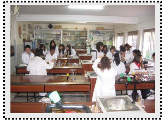
FOTO 4. En pleno trabajo en la laboratorio con las muestras de agua (análisis químico).

diferentes apartados, con los datos de la situación medioambiental se procedió a la