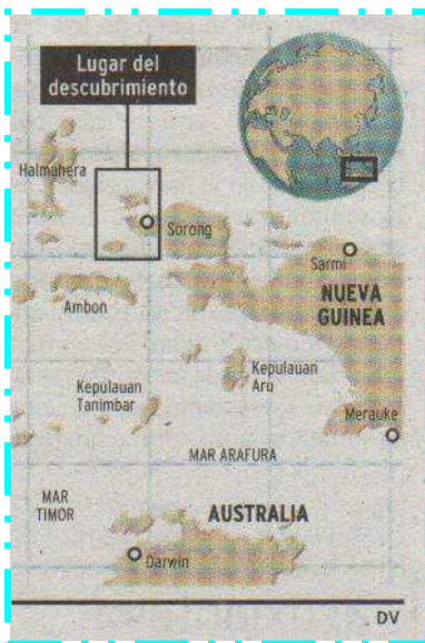
MAPA 1. Zona del descubrimiento de nuevas especies.

Se trata, en definitiva, de auténticas “fábricas de especies marinas que precisan una atención especial ante las amenazas existentes”. (Ver MAPA 1 ).