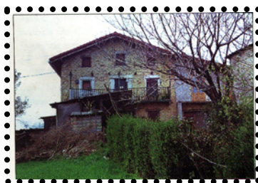
FOTO 34. Borda.

Fábrica de mampostería, caliza y arenisca, en gran parte a la vista en la mitad