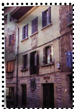
FOTO 56. Jamot-enea.

Edificio de planta rectangular con cubierta a dos aguas y el caballete paralelo a la fachada. Altura de tres plantas con una composición centrada de los huecos de la fachada, toda ella en piedra de sillería.