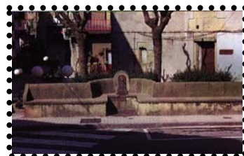
FOTO 50. Fuente San Juan.

Es una de las tres fuentes públicas de Lezo que se hayan situadas en las tres salidas del casco. (Kale Nagusia, Zubitxo, San Juan).