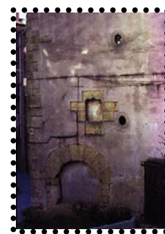
FOTO 51. Casa de la calle San Juan Nº 2.

Edificio de planta irregular y tejado a dos aguas. Tiene una altura de cuatro plantas. Los muros están revocados con recerco de huecos y esquinales en sillería. En la fachada lateral hay dos ventanas, una de ellas con arco conopial de medio punto adovelado y ambas están cegadas.