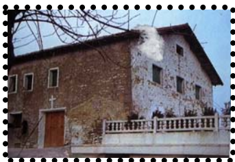
FOTO 40. Herrikoetxe.

Caserío bifamiliar de gran tamaño y planta rectangular con pequeños adosados. De dos plantas y desván, tiene la cubierta a dos aguas con caballete paralelo a la fachada principal, al Este.