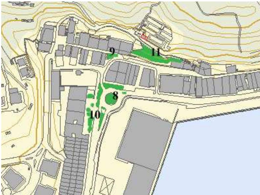
PLANO DISTRITO PASAI SAN PEDRO (PLANO 2).