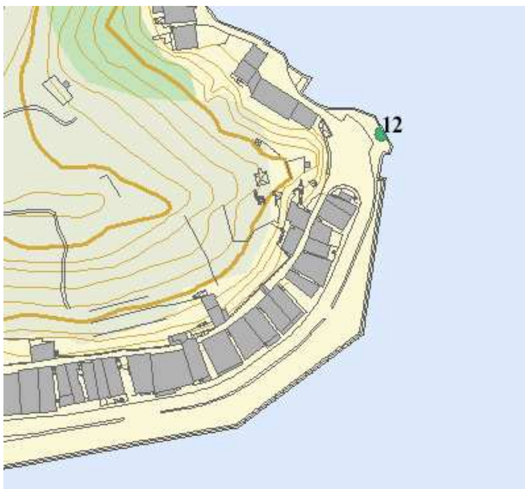
PLANO DISTRITO PASAI SAN PEDRO (PLANO 3).