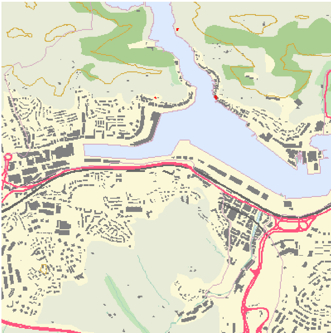
PLANO GENERAL DE LA ZONA DE PASAIA