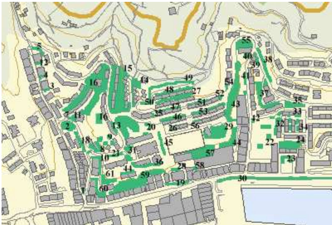
PLANO DEL DISTRITO TRINTXERPE .

-Por ello pensamos que esto ha de dar la vuelta y seguir otro rumbo, el de un núcleo urbano limpio, con zonas verdes en buen estado, y con buena accesibilidad, ya que en ello está situado el vivir del ser humano, el bienestar, y en general todo lo que un viandante necesita.