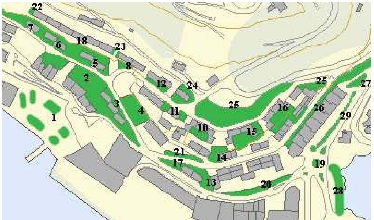
PLANO DISTRITO PASAI DONIBANE.

-Esta puntuación permite deducir, que los jardines de este distrito en cuanto a calidad se refiere son correctos, no todo lo bien que deberían pero su media es de una las más altas, por lo que se puede dar un aprobado a este distrito a los datos recogidos.