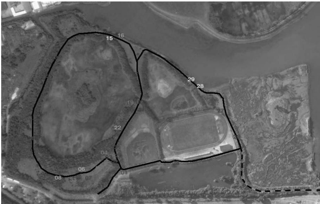
Figura 2. Mapa del paseo botánico del Parque ecológico Plaiaundi.

• Junto con la guía de clasificación también adjuntar el paseo botánico por el cual el visitante se encontrara con paneles informativos a cerca de las especies de árboles que encuentra a su paso.