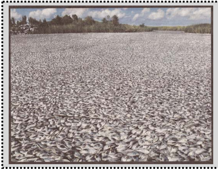
FOTO 1. Peces muertos en Luisiana.

Miles y millones de peces muertos, jamás podrán contarse ni pesarse, el gran río que afinales de agosto de 2010 se vistió de luto por la misma tragedia. El estado norte americano golpeado por el Katrina y el vertido de la British Petroleum, cangrejos, anguilas de río, truchas, pescadillas, camarones y rayas amontonadas, ni siquiera pueden flotar.