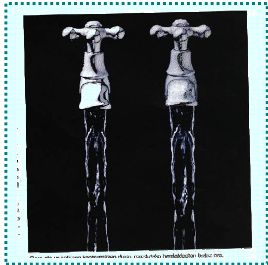
FOTO 39.- Dos grifos de agua.

Por otro lado, hay que tener en cuenta el mal uso que se da el agua desalada en España. Ya que España es el país del mundo que destina el 22% del agua desalada para la agricultura. (Ver FOTO 39. )