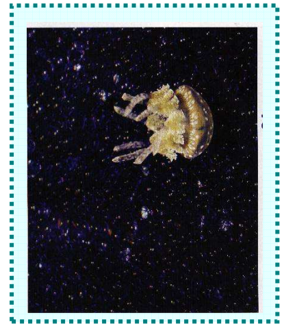
FOTO 17.- Medusas.

También tienen que tener en cuenta el protocolo para la recogida y estudio de las medusas detectadas que tienen que seguir para que este plan sea posible y para que la gente esté más tranquila cuando vaya a la playa (Ver FOTO 17. ).