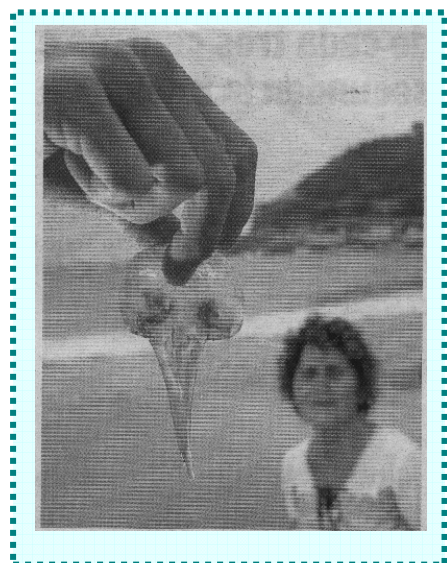
FOTO 19.- Medusas en la playa de la Concha.

La llegada de estos animales en plena primavera causó cierta extrañeza en el colectivo de bañistas, los meses estivales. “En junio y agosto si