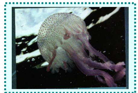
FOTO 15.- La medusa luminiscente.

Su toxicidad es moderada. (Ver FOTO 15.)