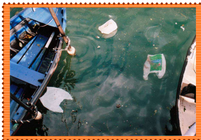
FOTO 51. Las campañas de sensibilización deben perseguir evitar estos vertidos.