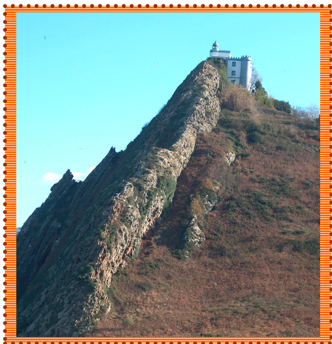
FOTO 49. Acantilados del Faro de La Plata de urgente protección.