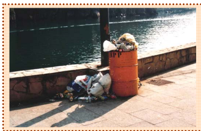
FOTO 26. Papelera del Paseo de Puntxas, colmatada.